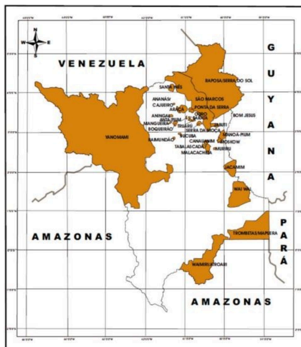
Figura 2: Mapa das Terras Indígenas de Roraima.